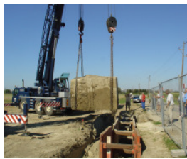
Der Block wird aus der Künette gehoben

Bei genauerer Betrachtung stellte sich heraus, dass es sich beim Fund um eine Panzersperre aus dem Zweiten Weltkrieg handelt. Aufgrund der außerordentlichen Größe mussten die Bauarbeiten kurzfristig an dieser Stelle unterbrochen werden.