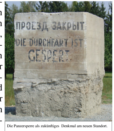
Die Panzersperre als zukünftiges Denkmal am neuen Standort.