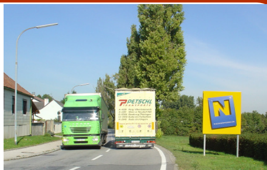
Dieses Bild sollte ab Mitte November der Vergangenheit angehören.

Die lange ersehnte Fertigstellung der Autobahnverbindung A6 Spange Kittsee zwischen Bruck und Kittsee wird am 19. November 2007 endlich seiner Bestimmung übergeben werden