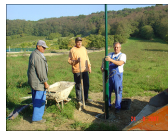
Die Gem.arbeiter beim Einbetonieren der Steher.

Zwischen dem Haus von Hr. Happel Herbert und dem Haus der Fam. Kristza sowie im Bereich des „oberen“ Unterschilling wurden neue Beleuchtungskörper installiert, nachdem dort eine Verkabelung bereits vorgesehen war. Die Vervollständigung der Beleuchtung ab den Häusern Höhe Rimele/Günther bis zur Halle Krapf ist ebenfalls vorgesehen. Die Verlegung des dazu erforderlichen Erdkabels soll in absehbarer Zeit erfolgen.