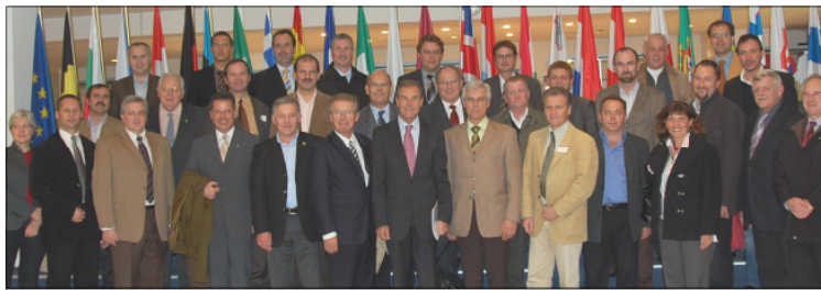
Bürgermeister und Regionsvertreter im EU Parlament in Brüssel.

Nicht zuletzt aus diesem Grund war ich gemeinsam mit vielen Bürgermeistern des Bezirks vor wenigen Tagen auf Studienreise in Brüssel, wo in den Gremien der EU und bei den österreichischen Vertretungen die Entwicklungen und Zukunftsprognosen erörtert und diskutiert wurden.